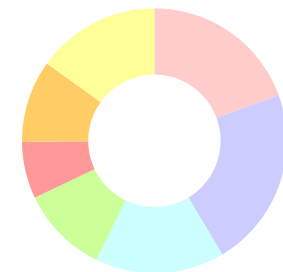
พนักงาน (แยกตามอายุ)